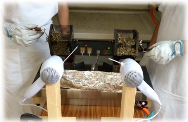
焙煎・・・やや深煎りに・・・