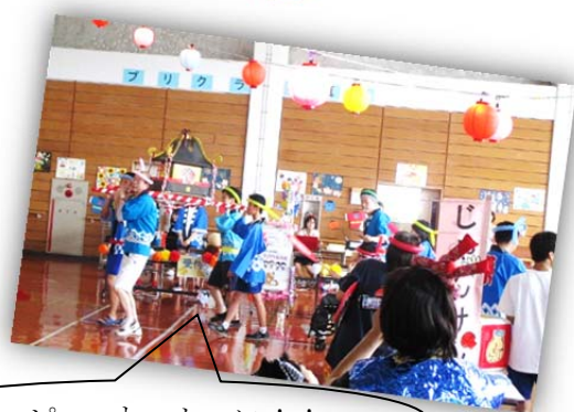
ピッピッ わっしょい!!