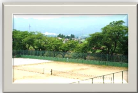
テニスコート脇の野川河川敷