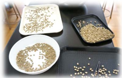
ブラジル産の生豆を丁寧に選別