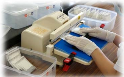
計量・袋詰め・ラベル貼り