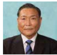
坂本 貴美雄 議長