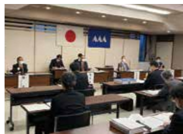
最上地域議員協議会の様子

11月18日、各総合支庁において、地域議員協議会を開催しました。 それぞれの地域における行政課題や施策展開について、地元選出の県議会議員が幅広く調査・審議し、さまざまな提案を行いました。