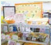
山形県庁地下売店での展示販売

障がい者施設で作られた商品を購入することは障がいのある方の自立を応援することにつながります