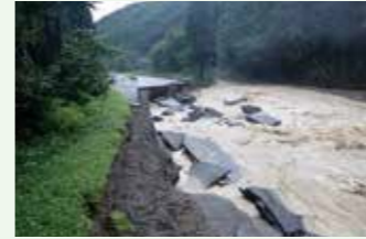
令和4年8月の豪雨災害

地球上では温暖化により、集中豪雨や猛暑が頻発し、人々の生活に大きな影響を与えています。また、プラスチックごみによる海洋汚染や海の生き物への影響も深刻です。 こうしたさまざまな問題の解決に向けて、私たち消費者一人ひとりが