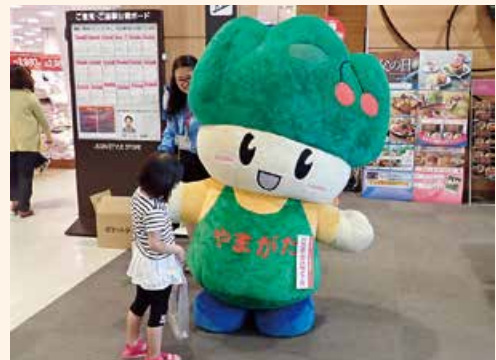
街頭啓発活動の様子