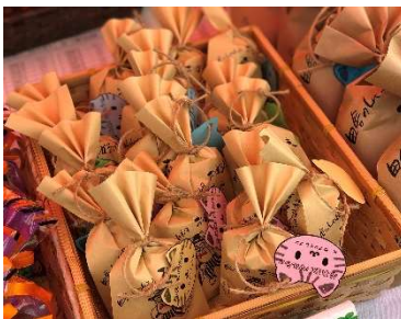
※写真は商品のイメージです。