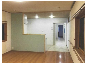
改修後 カウンターキッチン