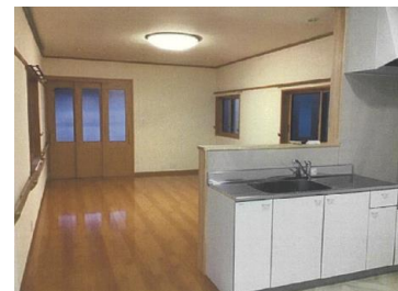
改修後 カウンターキッチンから見たLDK