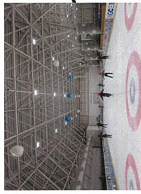
新潟市アイスアリーナ スケートと併用 18時～利用可