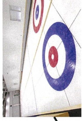
アイスリンク仙台