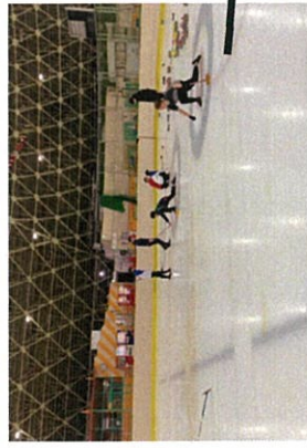
秋田県立スケート場 スケートと併用 夜間のみ利用可