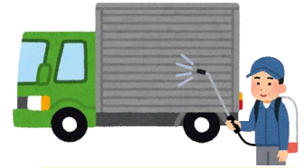
衛生管理区域に 立ち入る車両の消毒