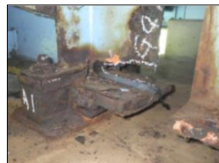
▲主桁・支承部の腐食状況