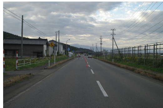
【Aの進路方向から見た現場の状況】