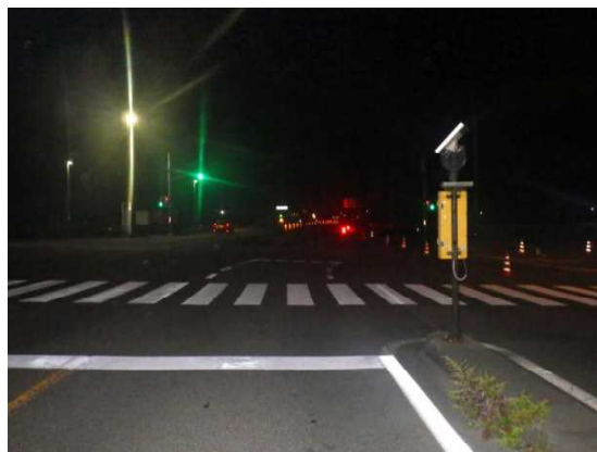
【Aの進行方向から見た現場の状況】