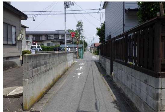
【Aの進路方向から見た現場の状況】