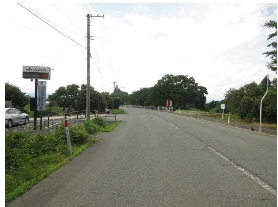
【Aの進路方向から見た現場の状況】