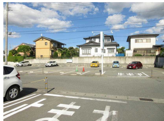
【Aの進路方向から見た現場の状況】