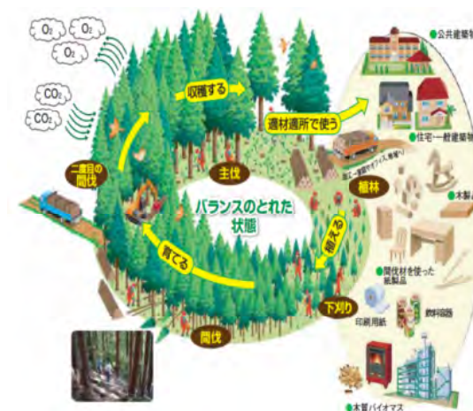
健全な森林のサイクル