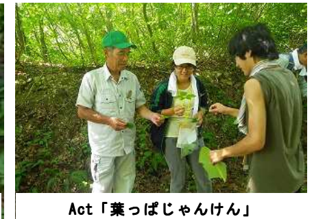
Act「葉っぱじゃんけん」