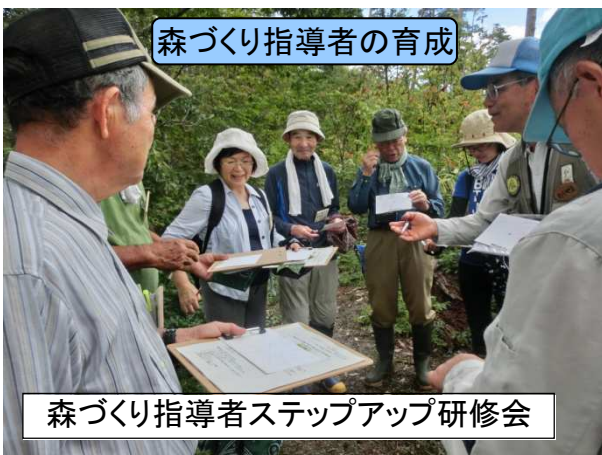
森づくり指導者の育成