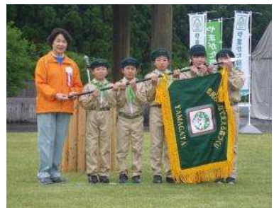
▲森づくりリレー やまがた森の感謝祭 2015 をスタートに、県内各地の森づくり活動をつなぎます