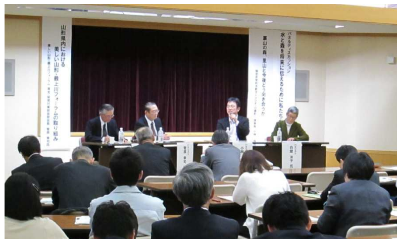
【美しい水と森のフォーラム（村山・置賜地域）(H27. 11. 26)】

「美しい水と森のフォーラム」及び「やまがた環境展 2015」で水資源保全のパネルを展示