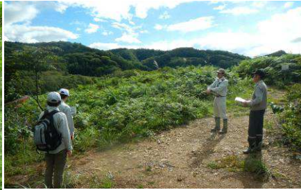
人の伐採利用から発生した里山二次林