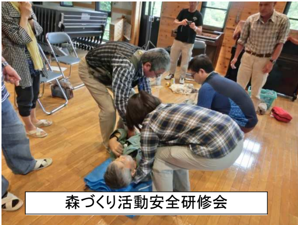
森づくり活動安全研修会