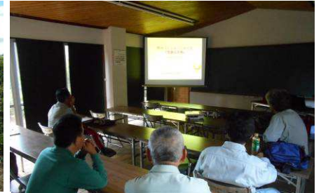
活動事故の対処法シュミレーション