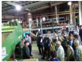
▲ペレット工場(寒河江市) ・家庭用ペレットストーブ(山形市) 11月 3日に見学 ・37名参加