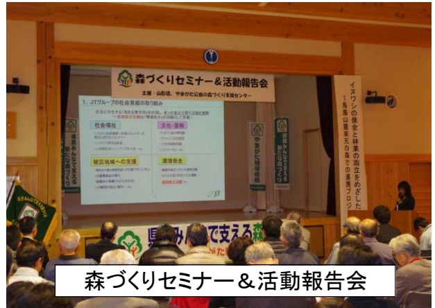
森づくりセミナー&活動報告会