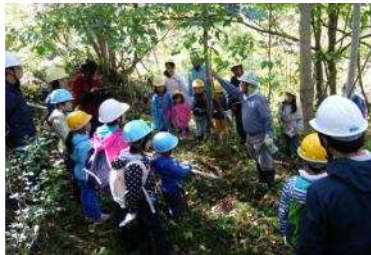
▲間伐体験会 10月 12日、11月 3日 山形市八森で実施 ・95名参加