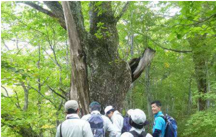
ギャップ形成から始まる奥山の天然更新

○奥山林と里山林の更新方法と人とのかかわりの違いを学ぶほか、森林活動におけるリスクマネジメントを実習する。