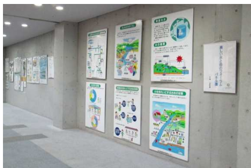
【美しい水と森のフォーラム（最上・庄内地域）(H27. 11. 24)】

「美しい水と森のフォーラム」及び「やまがた環境展 2015」で水資源保全のパネルを展示