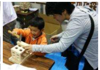
▲木クラフト体験 ・林業まつり (10月 17日～18日) ・やまがた環境展 (10月 24日～25日) その他、森の感謝祭、 地域感謝祭などで実施