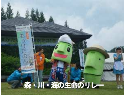
森・川・海の生命のリレー