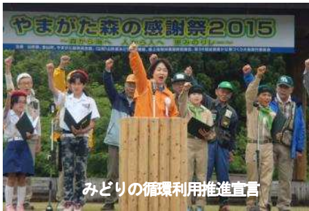
みどりの循環利用推進宣言