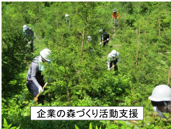
企業の森づくり活動支援