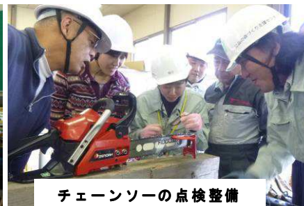
チェーンソーの点検整備