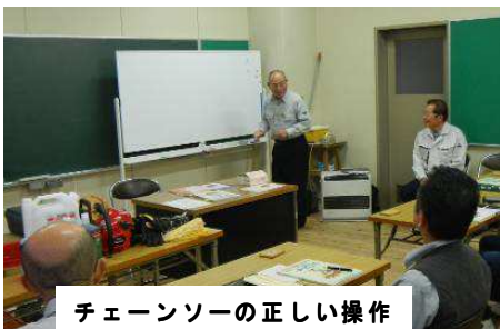
チェーンソーの正しい操作

○森づくり活動に必要な技能、安全なチェーンソー操作技術を身につける。(写真はH26のもの)