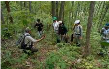
講義「森林環境教育のための森づくり」