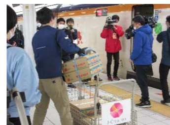
山形新幹線によるラ・フランスの荷物輸送