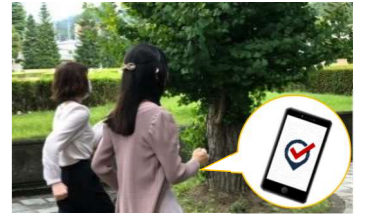
デジタルを活用したウォーキング事業(イメージ)