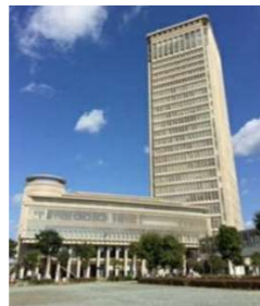
創業支援センターを設置する霞城セントラル