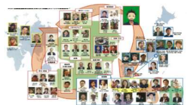
ビジネス関係人口の創出(イメージ)