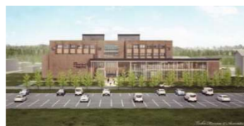
東北農林専門職大学(仮称)(イメージ)