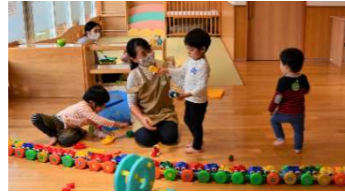
子育て支援施設での保育の様子