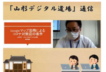
山形デジタル道場