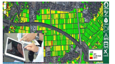
衛星リモートセンシングによる生育診断