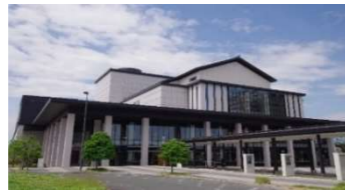
県総合文化芸術館