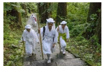
出羽三山での山伏修行体験