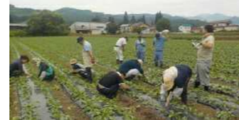
農福連携事例(大根の間引き作業)