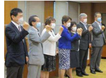
新型コロナワクチン接種事業の実施に関する合同発表