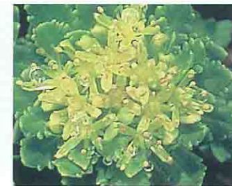
ホソバイワベンケイ