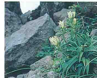
トウヤクリンドウ

世界有数の豪雪地帯月山には、大別して雪田群落(夏まで残る雪のため、生育期間の極端な短縮による、好雪性の植物によって構成される群落。代表的な植物:ミヤマリンドウ、チングルマ、アオノツガザクラ等)、湿性群落(斜面上部の雪解け水に涵養されて成立する湿原に見られる群落。代表的な植物:スマガヤ、イワイチョウ、ワタスゲ等)、風衝群落(季節風が直接つきあたる箇所に生育する嫌雪性の高さの低い矮小低木の群落。代表的な植物:ガンコウラン、イワウメ、コメバツガザクラ等)の3つの植生があり、各々特徴的なお花畑を形成しています。