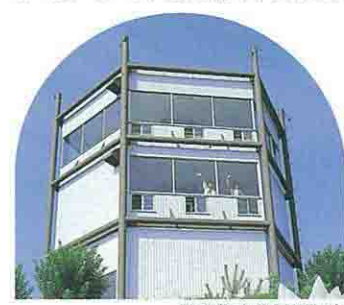
猿羽根山公園展望台

この丘から赤い橋を渡った所に展望台がある猿羽根山遊園地があります。展望台は公園の一番見晴らしの良いところにあり、眼下に日本三大急流で山形県の母なる最上川を眺め、