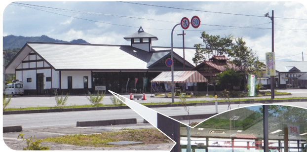
道の駅たかはた ウォーキングセンター