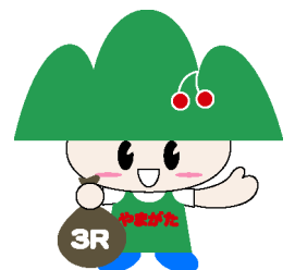
ごみゼロやまがた県民運動キャラクター『ごみゼロくん』