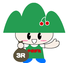
ごみゼロやまがた 県民運動キャラクター 『ごみゼロくん』