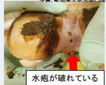
水疱が破れている