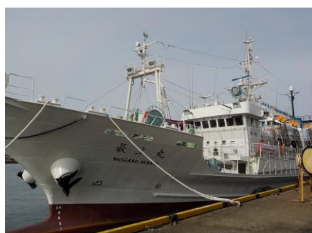
【漁業試験調査船「最上丸」】