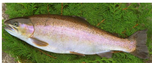
【山形サーモンニジサクラ】