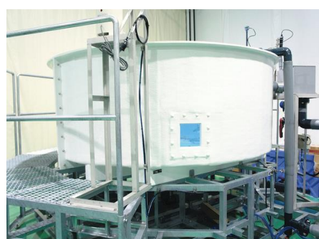
【サクラマス陸上養殖施設】