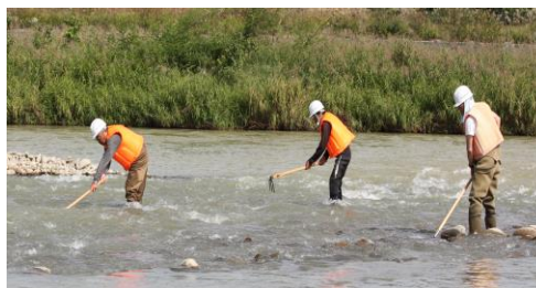
【水産多面的機能発揮対策事業】