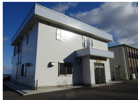
【おいしい魚加工支援ラボ】