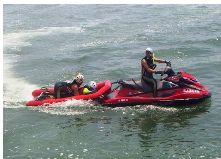
【水上バイクによる海難救助】