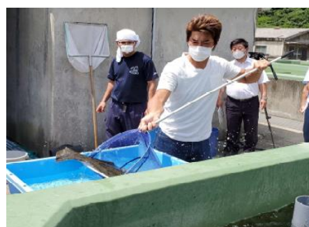
【栽培漁業センターでの蓄養】