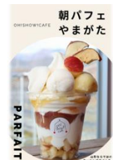
朝パフェやまがた キャンペーン