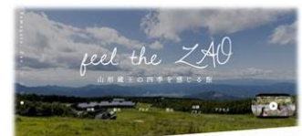
蔵王総合情報発信サイト「feel the ZAO」

蔵王地域を世界オンリーワンリゾートとして確立するとともに県内全域へ周遊を促進するため、総合情報サイトでの戦略的情報発信やユニバーサルツーリズムなど持続可能な観光地づくりを推進。加えて、山の日全国大会と連携した情報発信や旅行商品の造成支援を実施。