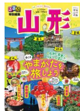
山形県版ガイドブック