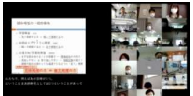
会場での参加とオンライン参加によるハイブリッド形態