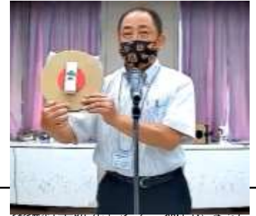
環境科学研究センター職員によるリサイクル工作の紹介。幼稚園・保育所や児童クラブで活用できるプログラム内容でした。

ハイブリッド型の研修会でしたがスムーズに研修を行うことができました。参加者からは「Zoomでのオンライン研修は初めてだが不便なく参加出来た」という感想をいただき、コロナ禍でもしっかりと学ぶことができる方法が確立されてきたように感じました。