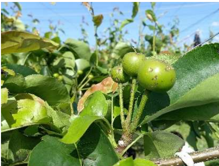
日本なし果実の打撲 (鶴岡市東荒屋)