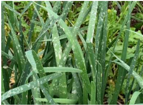
にらの被害 (真室川町平岡)