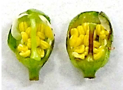
さくらんぼの雌しべの枯死 (右側)