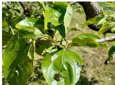
かきの葉の損傷 (鶴岡市羽黒町)