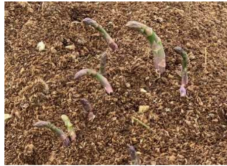
アスパラガスの被害 (新庄市二枚橋)