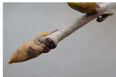
柿の芽枯れ (酒田市滝野沢)