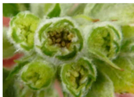
りんごの中心花の雌しべ枯死