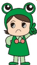
消費者教育推進大使 県消費生活センター キャラクター「ケロちゃん」

地方公共団体のふるさと納税を装った偽のサイトが複数開設されています。実際に寄附者が金銭をだまし取られる被害も発生しています。悪質な詐欺には十分ご注意ください。