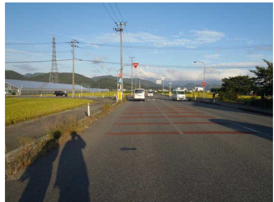
【Aの進行方向から見た現場の状況】