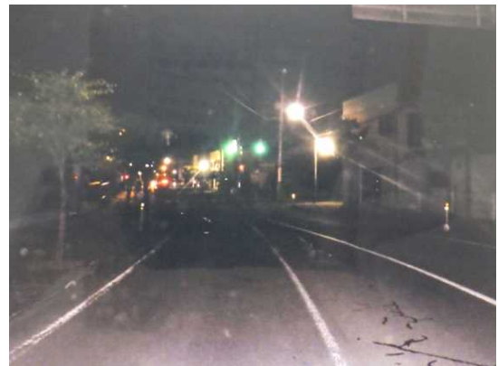
【Bの進行方向から見た現場の状況】