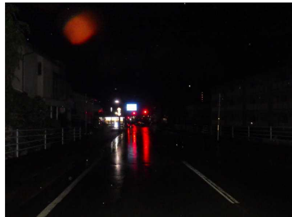
【Aの進行方向から見た現場の状況】

本年の死亡事故14件15人中、9人が高齢者!! 本年に入り、初めて横断者が被害に遭いました