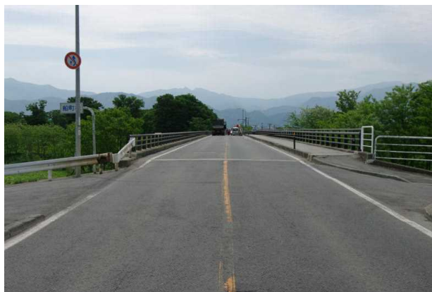
【Aの進行方向から見た現場の状況】

本年の死亡事故13件14人中、5件6人の事故が正面衝突!! 約4割の方が正面衝突事故で亡くなっています