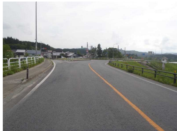
【Aの進路方向から見た現場の状況】