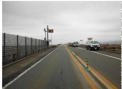
【Aの進路方向から見た現場の状況】