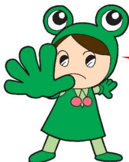
消費者教育推進大使 県消費生活センター キャラクター “ケロちゃん”