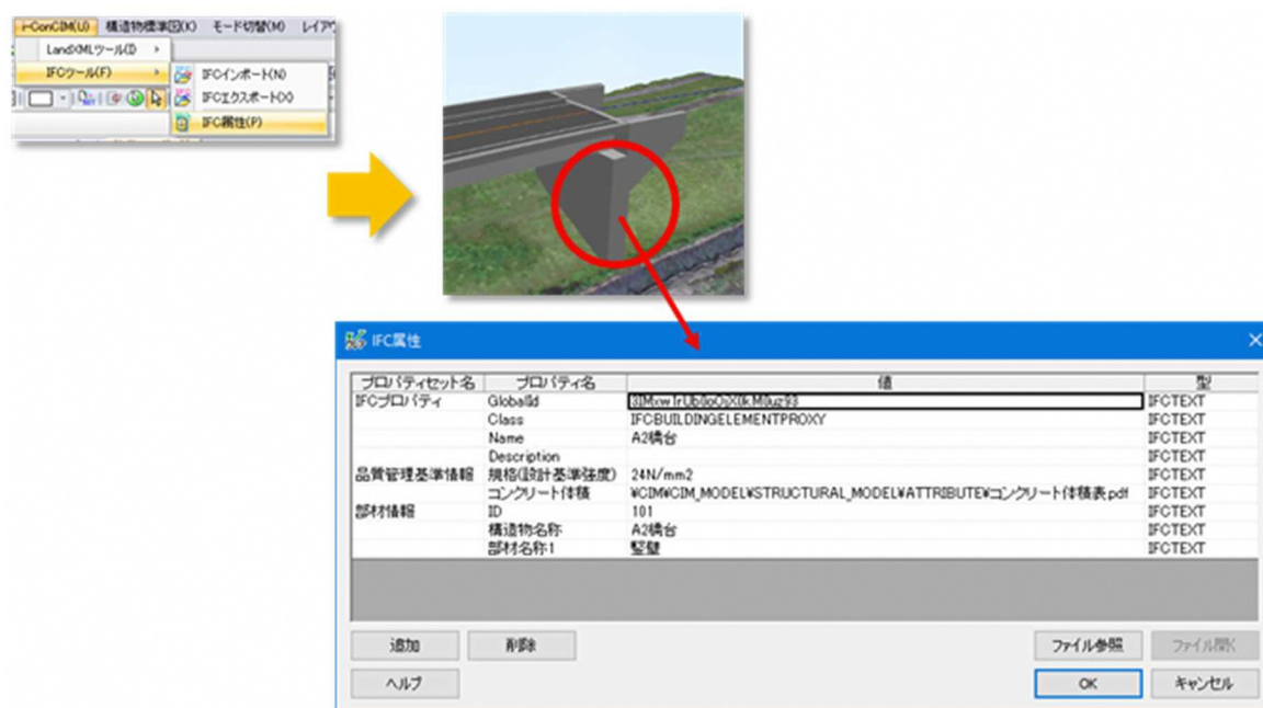
図 4 属性情報の表示

なお、必要に応じて、属性情報の付与に関する赤黄チェックの実施結果等の根拠資料の提示を求めることができる。