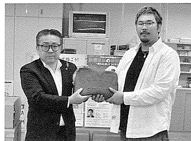
のみしん倶楽部Z 様 より