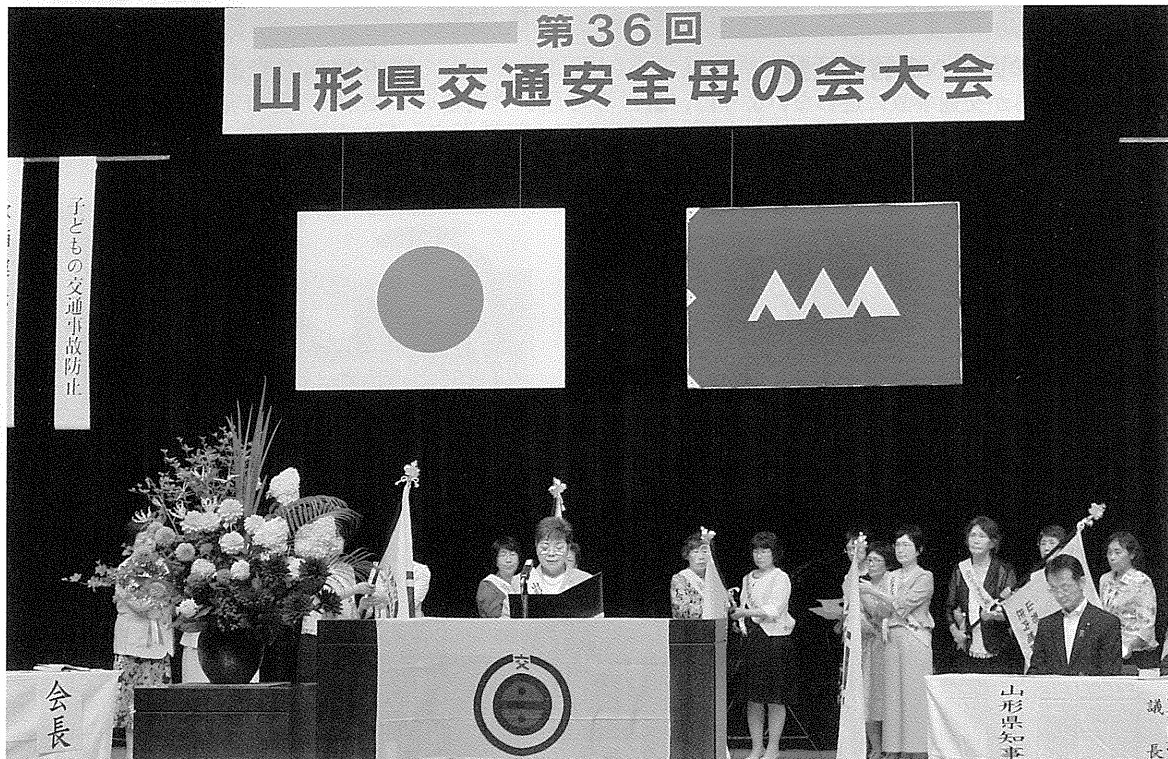
第36回山形県交通安全母の会大会（川西町フレンドリープラザ）