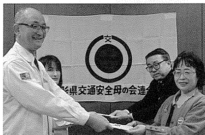
ミクロン精密株式会社 様、 ミクロン精密株式会社 輪の会 様 より