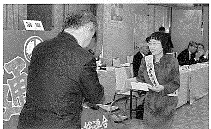
交通労連東北地方総支部 様より