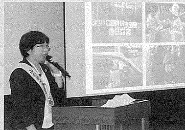
久連山副会長による発表