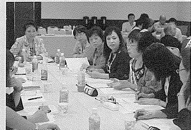
グループ討議の様子