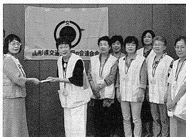
寒河江地区交通安全母の会 様 より