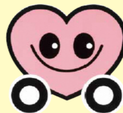
山形県交通安全シンボルマーク