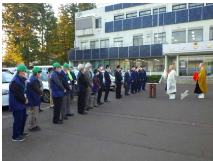
米沢署安全祈願祭