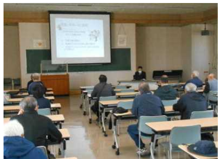
鶴岡署青パト講習

【県内の青パト情勢】 (令和3年5月末) 団体数171団体 台数2,286台 実施者数6,133人