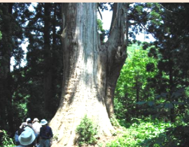
角川の大杉 樹齢1200年の今熊野神社の神木