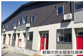
新築の完全個室社員寮