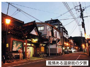
風情ある温泉街の夕景