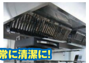
厨房設備は常に清潔に!

清掃、必要な点検及び整備など厨房設備の維持管理は「火災予防条例」で義務づけられています。