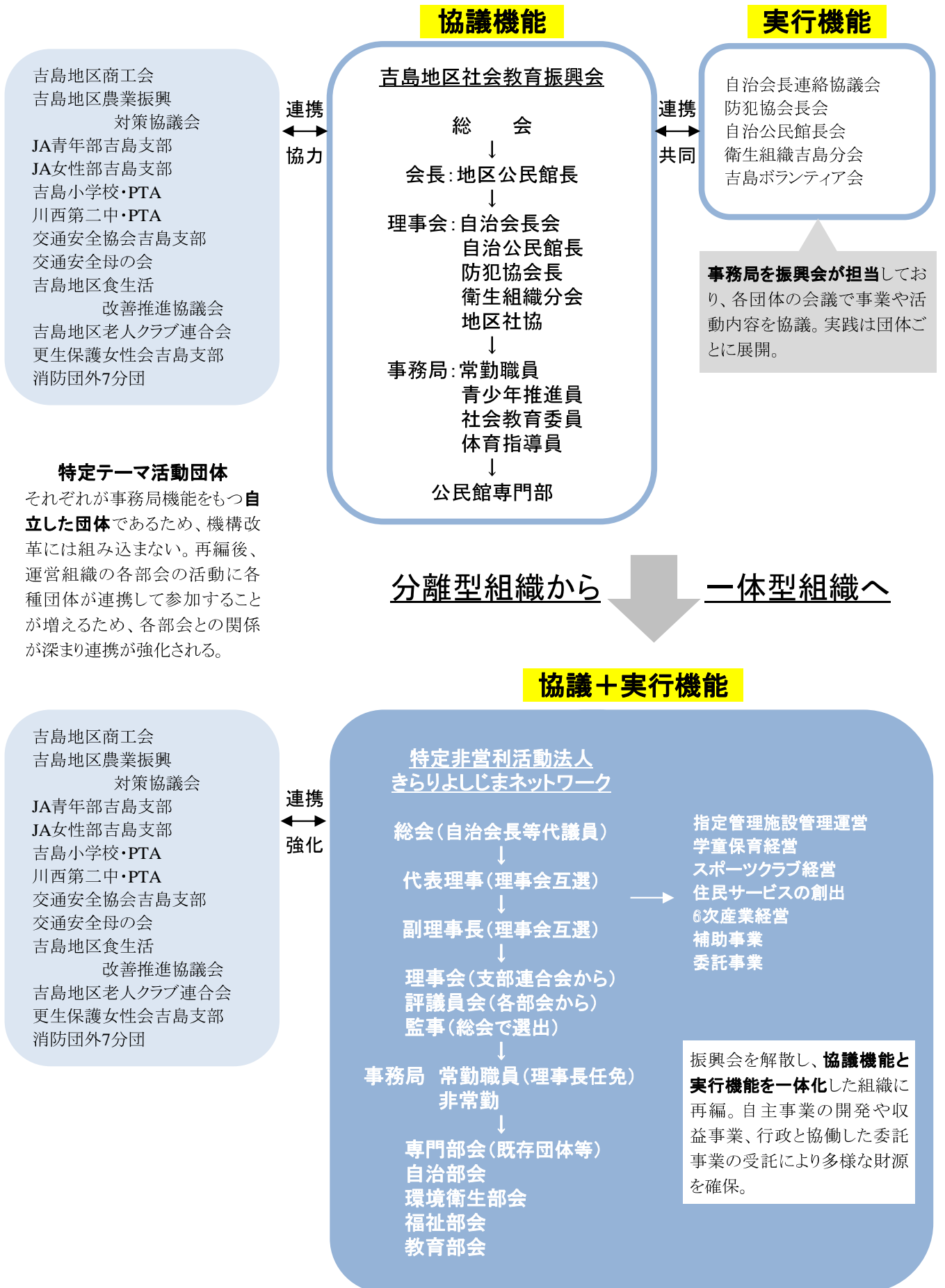
図表1-8 吉島地区の組織運営のイメージ