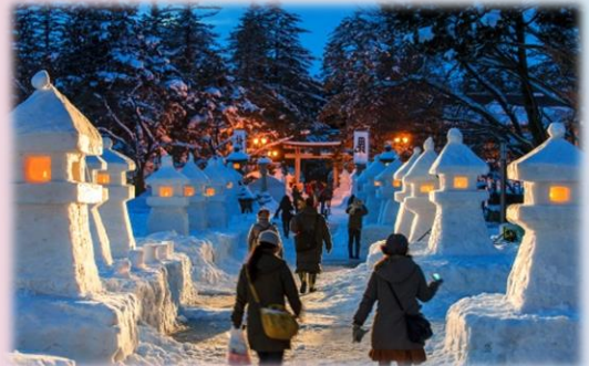
上杉雪灯籠まつり(米沢市)