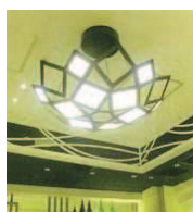
東京駅内飲食店の有機EL