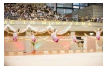
ブルガリア新体操チーム 事前キャンプ