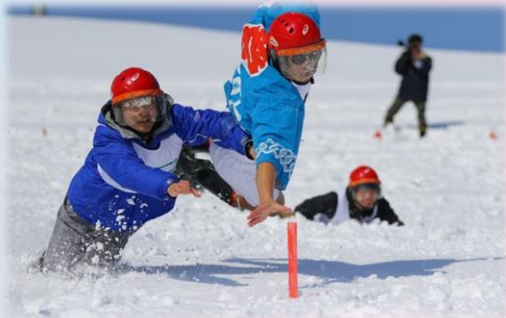
ホワイトアスロンワールドカップ(真室川町) (やまがた雪文化マイスターの活動)