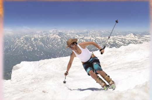
月山の夏スキー〔4月～7月〕(西川町)